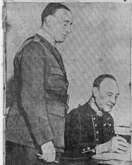
EL COMANDANTE EN JEFE DEL EJERCITO SUECO

10 Cts. - NOVEDADES - 10 Cts. Nº 1244 Director: Rafael Soley - Año V San José, Miércoles 10 de Abril de 1940